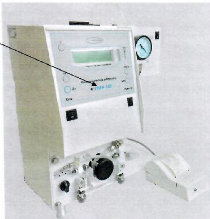
Рисунок 1 - Общий вид анализаторов фотометрических счетных механических примесей ГРАН-152 с обозначением места нанесения маркировки